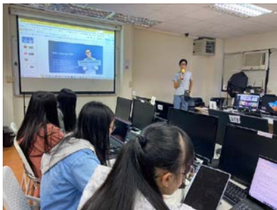
講師介紹個人經歷

演講中講師引導學生發現自己目前是如何沉浸在 AR 的世界裡面，同時也能開始思考如何設計 AR 互動的方式，藉由上機實際操作練習製作互動程式設計、學習如何用攝影機位置(也就是 AR 體驗時手機的位置)，觸發互動的 AR 體驗，在此類型的體驗中，將可以引導玩家，移動到特定的位置，做出指定的動作，用身體的動態來進行互動等各項體驗思維，透過實際項目實踐，帶領學生建立技術能力和創意思維，為未來數位創新領域做好準備。