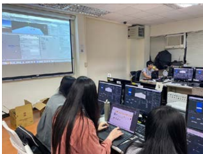
講師指導學生進行實做