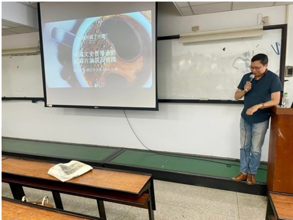
張導開場介紹主旨

本講座介紹與分析東方的紀實文藝傳統，包括歷史書寫、紀實長卷、墓誌銘、敘事詩/民歌。同時闡釋文科紀錄片的境相心法，如初到一境，先觀察與感受整體環境與氣場，繼而確認環境中的主體、次體與異體。攝相時，著重構圖、對比、光影，使之有通天地、氣韻生動之感。在細節的處理上，法門如：以局部來說明全部、以遮擋來看見現示、以不完全來指示完美、以物質來襯托符號、以前景來舉發背景、以異質來激發正質、以反射來看見直觀、以空缺來表達存在，以及客體來指涉主體等等。整體來說，注意人物的因果、因緣及超越感，意在言外。