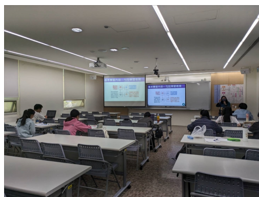
講師提供如何使用中學生常用字去讓學生練習，先使用字，再到詞，最後再讓學生用詞去造句