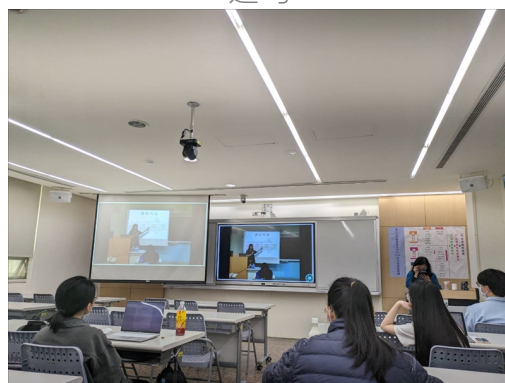
透過實際影片分享學扶的過程