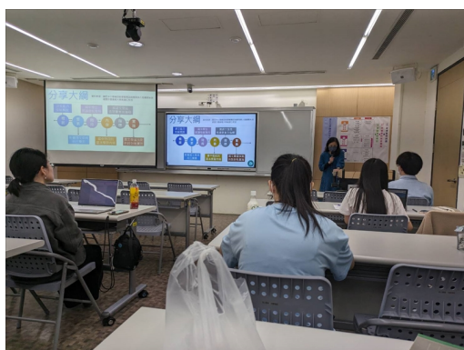
講師簡單介紹語文能力的發展

講師再來提供如何使用中學生常用字去讓學生練習，先使用字，再到詞，最後再讓學生用詞去造句，也有提醒如果學生無法造詞，可以適時直接換字，而學扶的其中一項目的並不是為了成績，而是要想辦法讓這些孩子可以適應未來生活為重，讓學生練習提取訊息、詮釋訊息、摘要訊息的步驟去了解文章，最後建議師資生最後一堂可以進行課程回顧，讓學扶的孩子了解到自己到底學了多少，給予關愛、並分享自己的學習，並透過實際影片來分享學扶的過程。