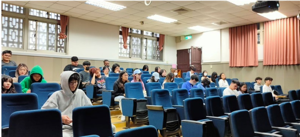
04_Students listening to the speech. 學生聆聽演講