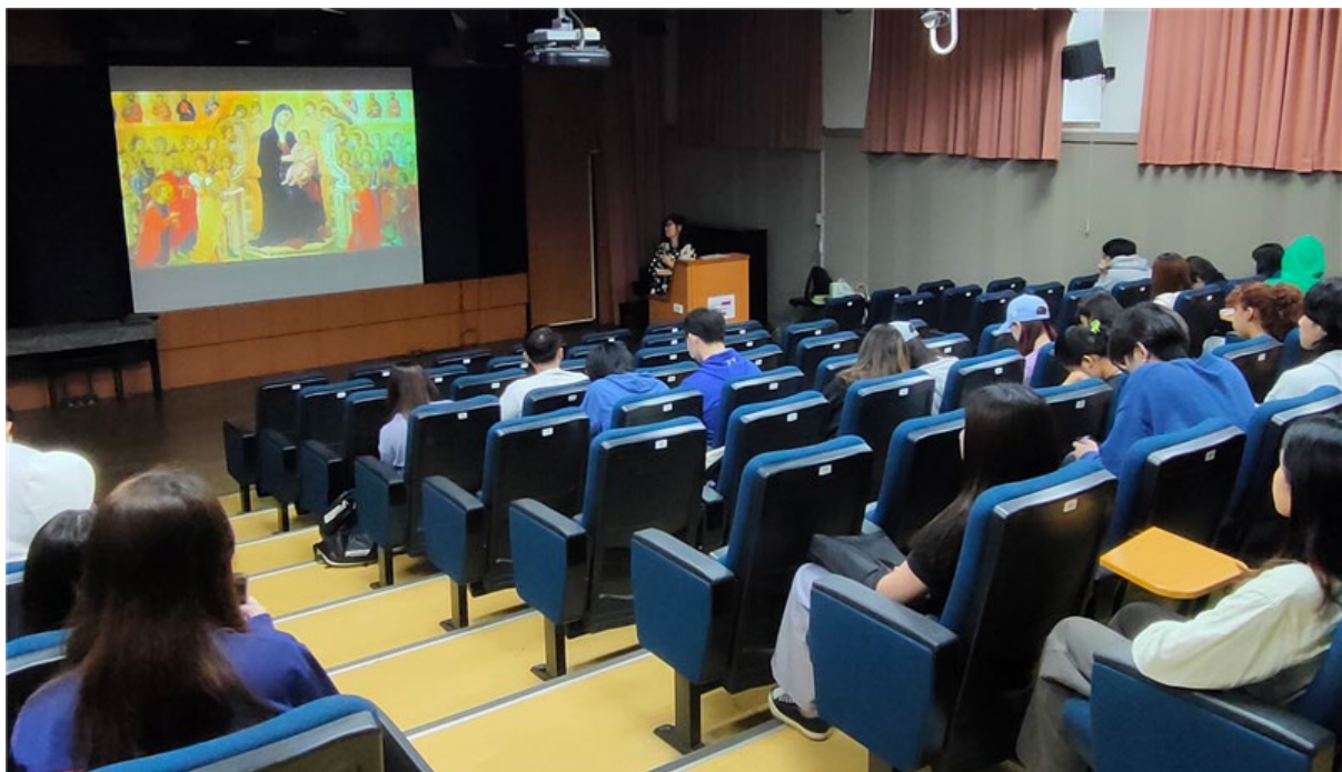
05 _Introducing the Icon Art of Maestà. 介紹《莊嚴聖母》聖像畫