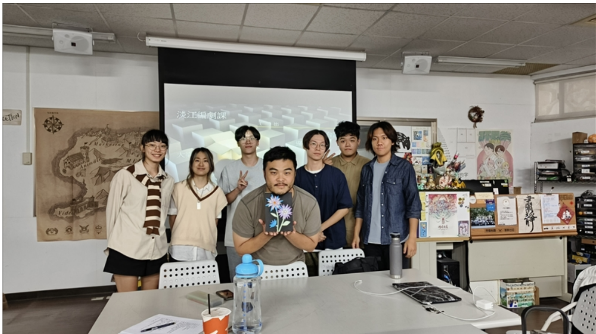
學生與業師大合照